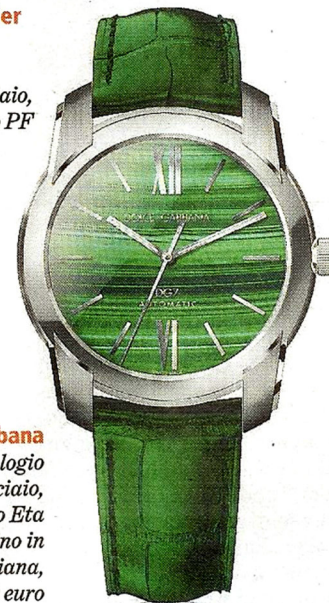
Dolce&Gabbana DG7, l'orologio automatico in acciaio, movimento calibro Eta 2892-A2, cinturino in alligatore Louisiana, 2.750 euro