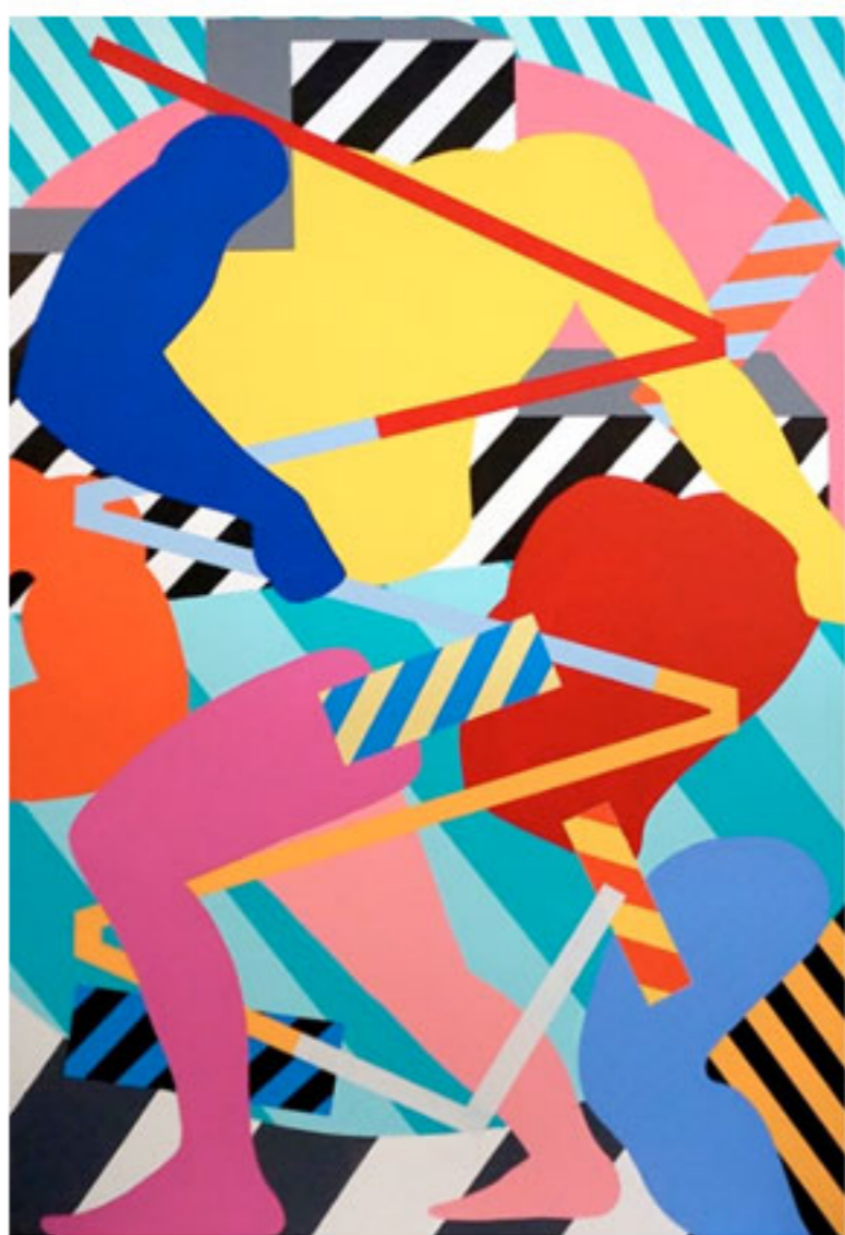
Maser per Cibus in Fabula

“Cibus in Fabula”, progetto ideato e curato dal digital storyteller Felice Limosani, affianca l'azione di ognuno degli artisti a delle elaborazioni video spettacolari, firmate dallo stesso Limosani e proiettate su un ledwall centrale di 7 x 10 metri. L'orizzonte è sempre lo stesso, per il video artista e i suoi tredici compagni di viaggio: cibo, nutrizione, benessere, gusto, pianeta, declinati ogni volta in chiavi diverse. Pigmenti e pixel, dunque, per un passaggio continuo tra segno pittorico e impulso elettronico, tra esperienza live e memoria, tra monumentalità e volatilità dell'immagine.